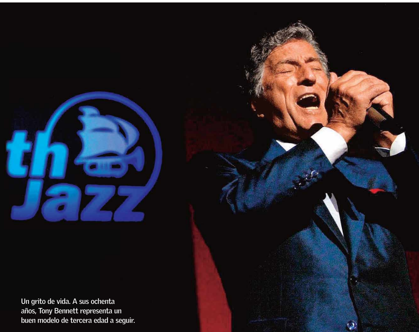
Un grito de vida. A sus ochenta años, Tony Bennett representa un buen modelo de tercera edad a seguir.

Flamante octogenario Tony Bennett celebró su cumpleaños a todo pulmón, mientras Fidel Castro se debatía entre la vida y la muerte.