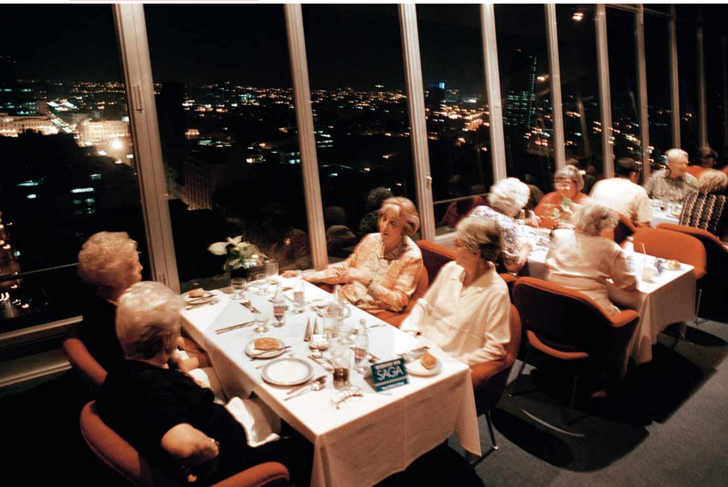
El "Sky Room", ambiente de lujo en las puertas del cielo. Artistas como Chabuca Granda o el "Puma" se presentaron allí.