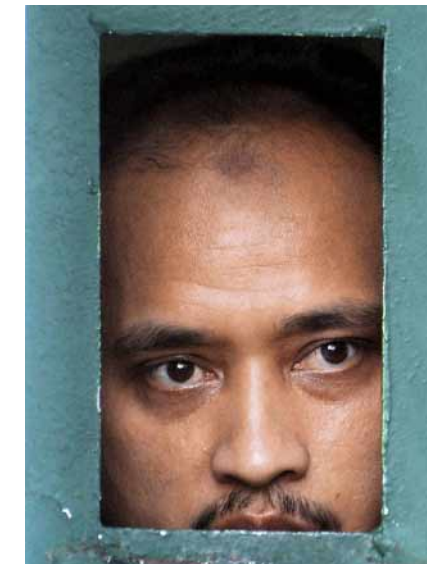
Iman Samudra mirando el mundo. Planeó 202 muertes. Espera morir desde el 2002