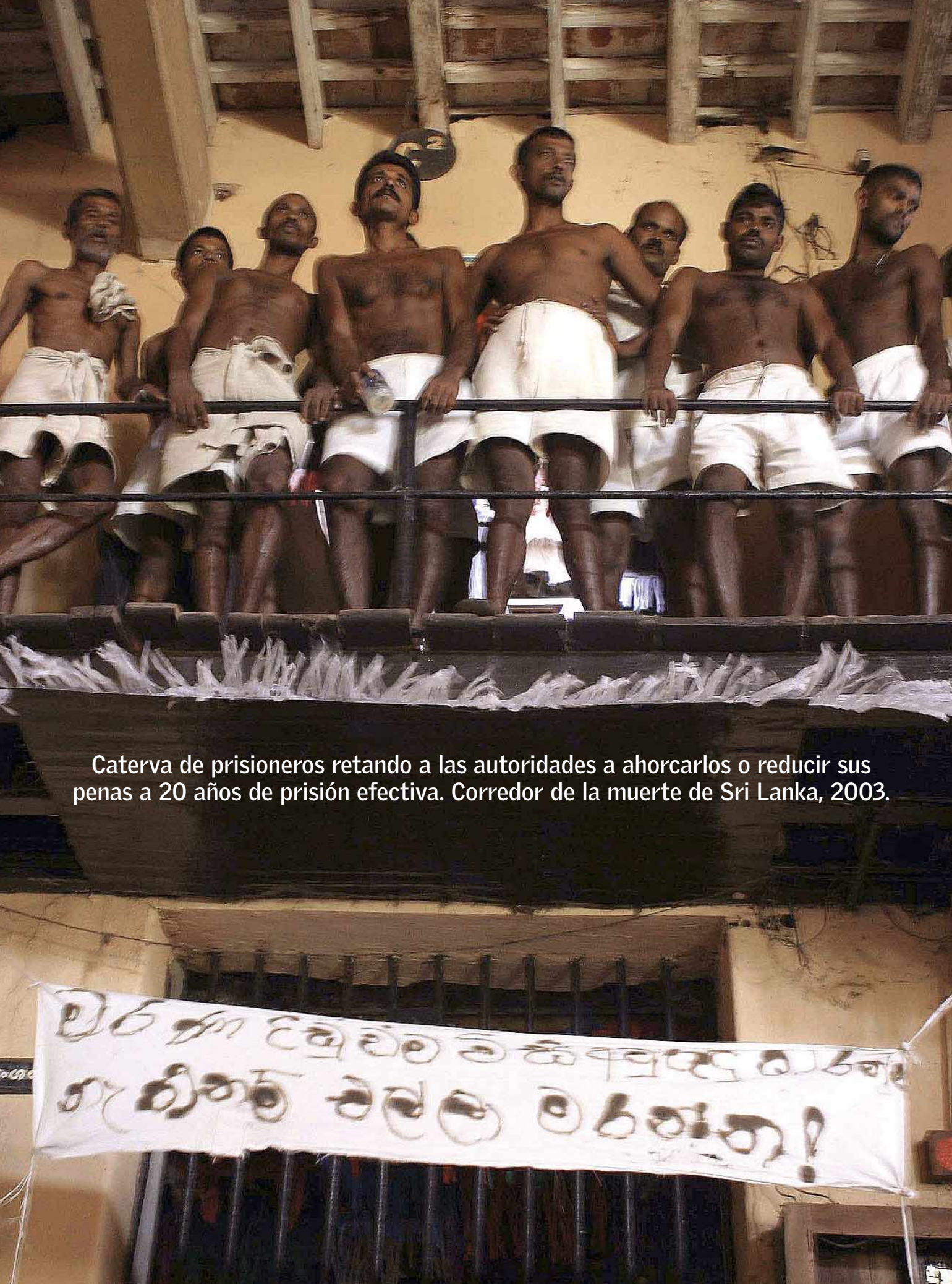
Caterva de prisioneros retando a las autoridades a ahorcarlos o reducir sus penas a 20 años de prisión efectiva. Corredor de la muerte de Sri Lanka, 2003.

El hálito macabro que el ojo por ojo de la pena capital deja en el mundo. ¿Es esto lo que se quiere en el Perú?