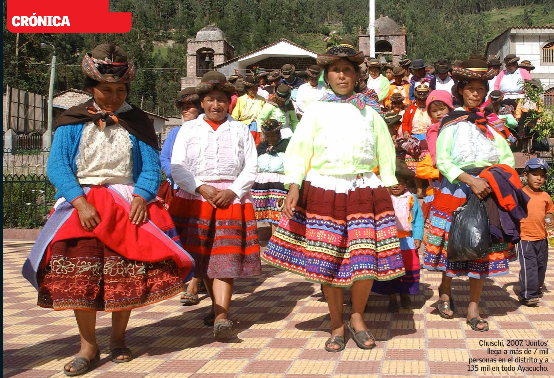
Chuschi, 2007. 'Juntos' llega a más de 7 mil personas en el distrito y a 135 mil en todo Ayacucho.