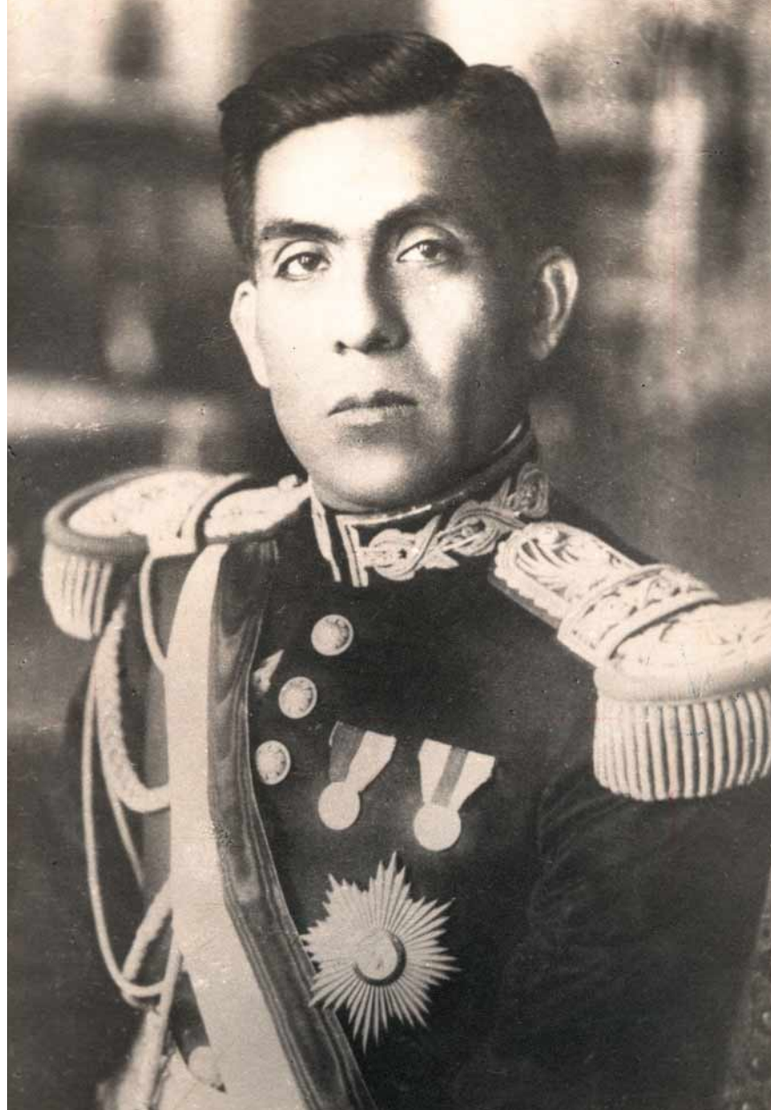
Comandante Luis M. Sánchez Cerro. Hacía sólo tres meses que había retornado al poder.