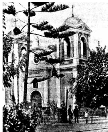
Así lucía la Iglesia hace ochenta años.

Después de las crispantes elecciones de 1931 –que dieron como ganador a Sánchez Cerro y el Apra denunció como fraudulentas–, cualquier cosa pudo suceder. El país se hallaba dividido en dos grupos irreconciliables: el Apra y la Unión Revolucionaria. La ley de Emergencia, la acusada intransigencia del Apra, el desafuero de 23 constituyentes, motín en el Callao, sublevación en el norte, persecución aprista y atentados como el que hoy recordamos, estremecieron al país en aquellos días, acaso los más turbulentos del siglo XX.