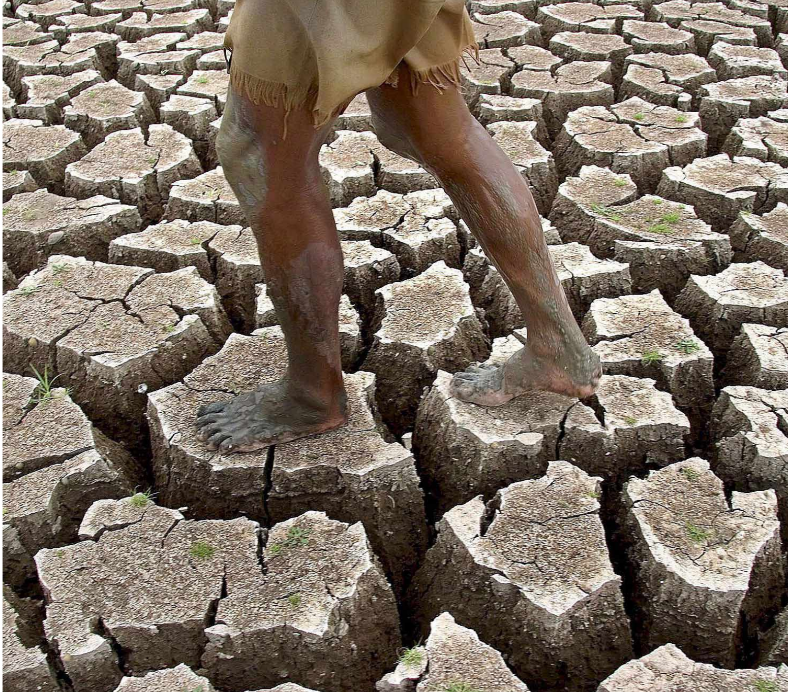
Los ríos de la costa languidecerían tras la desaparición de los nevados en los Andes en menos de 20 años.

P ARADÓJICAMENTE el último reporte sobre calentamiento global hiela la piel. El 4 de mayo último en Nueva York, el Panel Intergubernamental de Expertos sobre Cambio Climático (IPCC) de las Naciones Unidas (ONU) y la Organización Meteorológica Mundial (OMN) confirmaron la inquietante tendencia al alza de la temperatura mundial y alertaron sobre la posibilidad de violentos desastres climáticos en los próximos años. Habrà lluvias torrenciales e inundaciones cada vez más destructivas, el Fenómeno de El Niño será cada vez más depredador y, luego, vendrán las sequías.