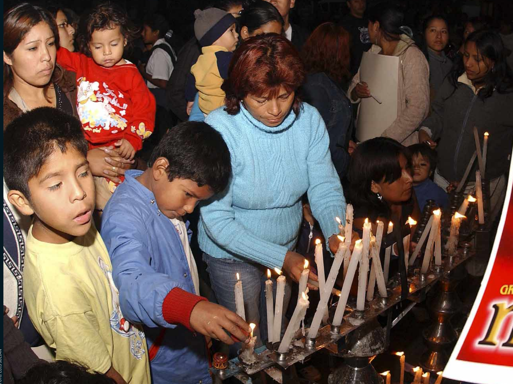
En esta casa de Collique, distrito de Comas, Johnny Orosco fue abandonado. Hoy el hogar se ha convertido en un santuario espontáneo por y para sus seguidores. Ayer, 13 de junio, se cumplió un mes de la tragedia.