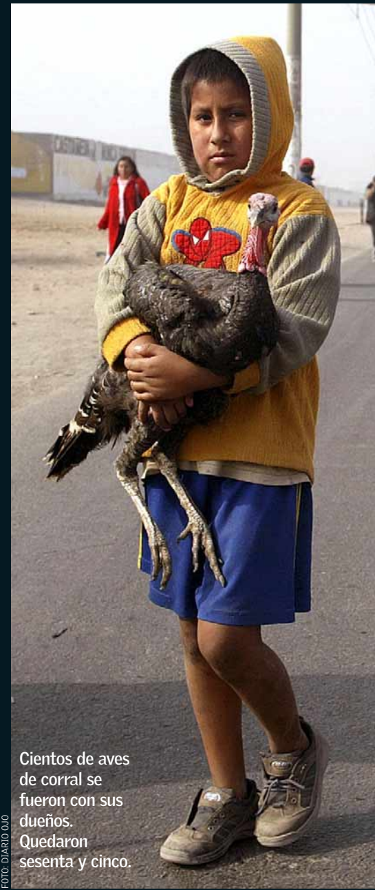
Cientos de aves de corral se fueron con sus dueños. Quedaron sesenta y cinco.

nar el local. Los animales, tanto las mascotas como los de corral, quedaron sueltos o abandonados a su suerte en medio del caos generalizado y a lo largo de un terreno de 82 hectáreas. Para cuando el portatropas tumbó la puerta principal del cerco del mercado, el desalojo había terminado y muchos animales yacían muertos (por falta de agua y alimento). Los miembros de UPA (Unidos Por Los Animales) fueron testigos de ello, pues entraron desde el segundo día del desalojo.