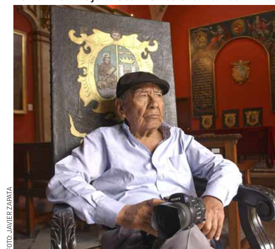
Carlos 'Chino' Domínguez, autor de las fotografías inéditas que acompañan la obra.