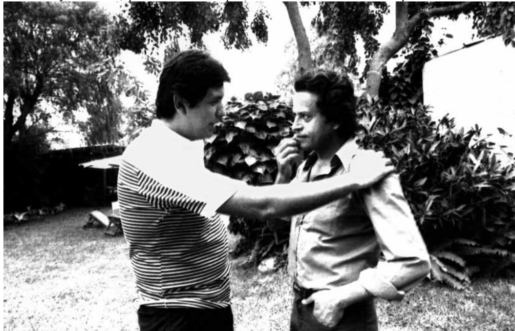
Alan García junto a Calvo, quien escribió: "En mi país, las tumbas / son más hermosas que las casas".

yeur. Una rendija que permite observar el trajinar creativo de un grupo de amigos o, según explica el poeta Reynaldo Naranjo, "el armonioso ejercicio de la imaginación".