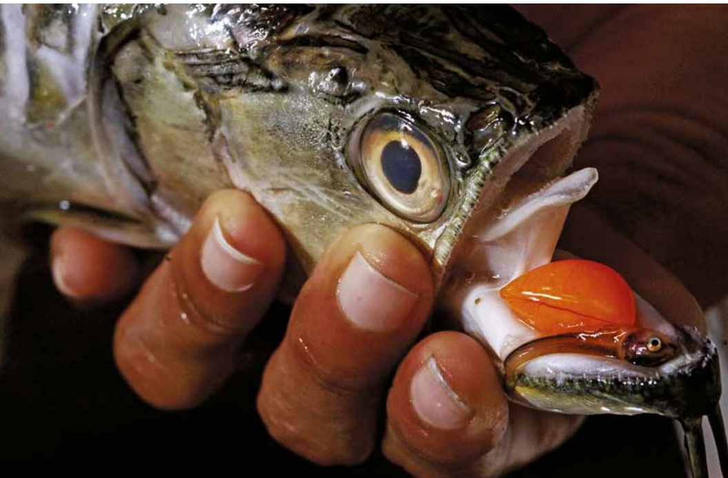
El padre Arahuan cobija a sus crías dentro de su gran boca durante cuatro semanas.

Singular especie del Pacaya – Samiria vale como ornamento, no como presa.