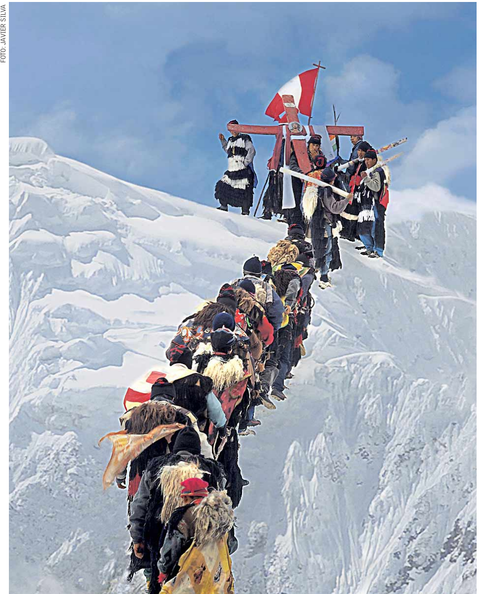
Peregrinaje al Santuario de Qoyllur Riti. Cada año, miles de devotos visitan al señor del hielo.

etapa que se inicia luego de la victoria inca sobre el poderoso pueblo chanca.