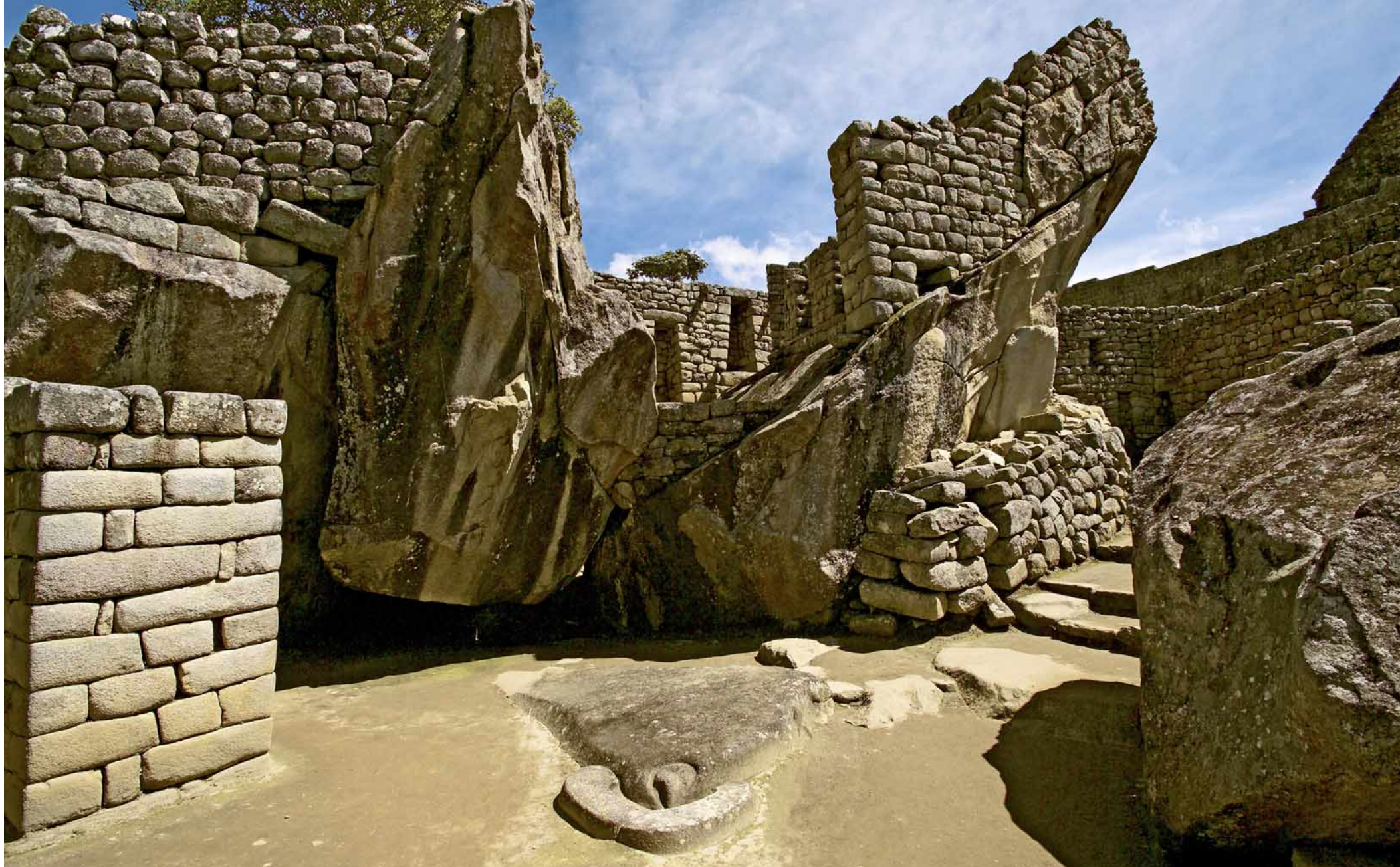
Afloramiento rocoso en Machu Picchu esculpido con la forma de un cóndor. La construcción del fondo asemeja las alas del ave.