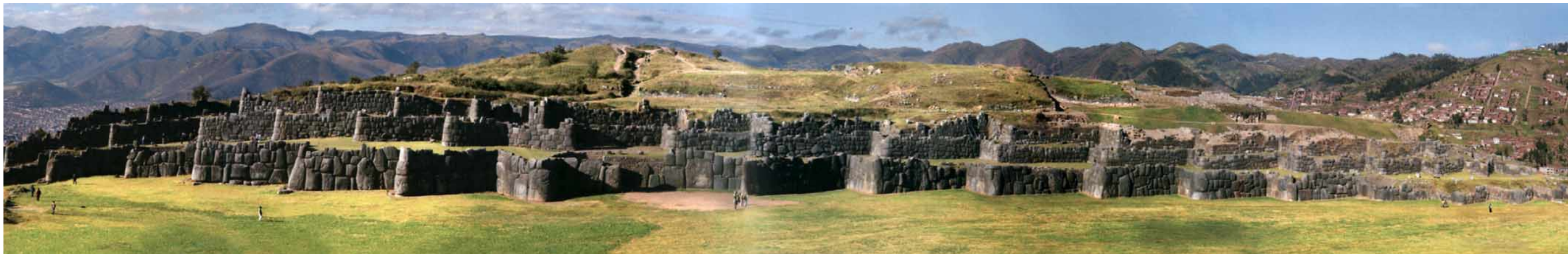
Vista panorámica de Sacsayhuamán. Los ángulos agudos de los muros estarían relacionados a Illapa, la divinidad del rayo. Según los autores, la civilización andina resalta entre otras de la antigüedad por haber domesticado la altura y el frío.

El libro, que destaca el valor del mito como otra forma de conservar la historia (“todo mito es verdad histórica narrada con alegorías, figuras literarias e incluso fantasías reales”), también hace hincapié en las técnicas de expansión de Pachacútec y quienes lo sucedieron. Técnicas que se pueden resumir de la siguiente manera: conciliar, y si no resulta, atacar. Esto, hasta llegar a convertirse en el gran imperio que asombró a los europeos a su arribo al Cuzco en 1533. Luego vendría la conquista y la superposición de la ciudad hispana sobre la urbe inca. Superposición, sin embargo, que no pudo extinguir el monumental legado arquitectónico de los habitantes del Cuzco, Cozco o Qosqo. ■