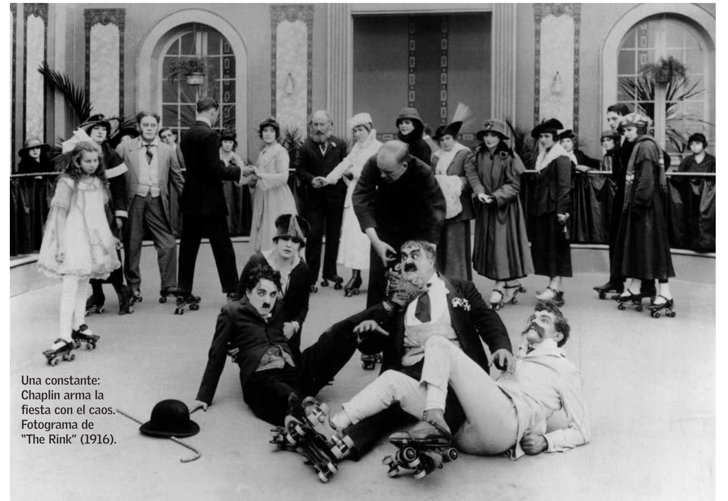
Una constante: Chaplin arma la fiesta con el caos. Fotograma de "The Rink" (1916).

El humor vence a la injusticia moderna: el 25 de diciembre, 30 años sin Chaplin.