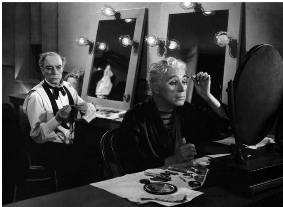
Vestuario de filmación de "Candilejas" (1952): Keaton mira a Chaplin cómo se maquilla.

na, enamora con la dignidad de un caballero, y sobrevive al hambre imaginando que su zapato es comestible. Sobre "La Quimera de Oro" (1925), José Carlos Mariátegui señaló que Charlot da un volantín sobre la muerte y se burla de ella. Charles Chaplin, en cambio, tuvo litigios por custodio de paternidad, fue acusado de heredar la tendencia al alcoholismo de su padre, y no ocultaba esa debilidad humana por las doncellas. No por nada dijo alguna vez: "Si quieren conocerme, vean mis películas".