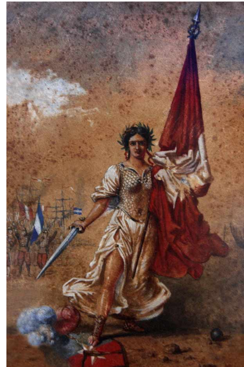
Victoria peruana según pintura anónima, circa 1879. Nótese la expectativa por Argentina al fondo. Der.: Telegrama que alerta sobre situación en Iquique.