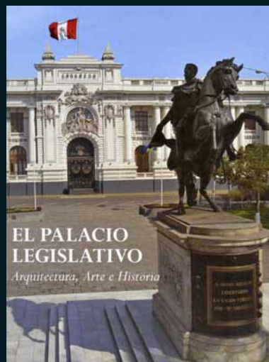
Flamante edición parlamentaria.

Libro editado por el Congreso de la República muestra los mil rostros del Palacio Legislativo.