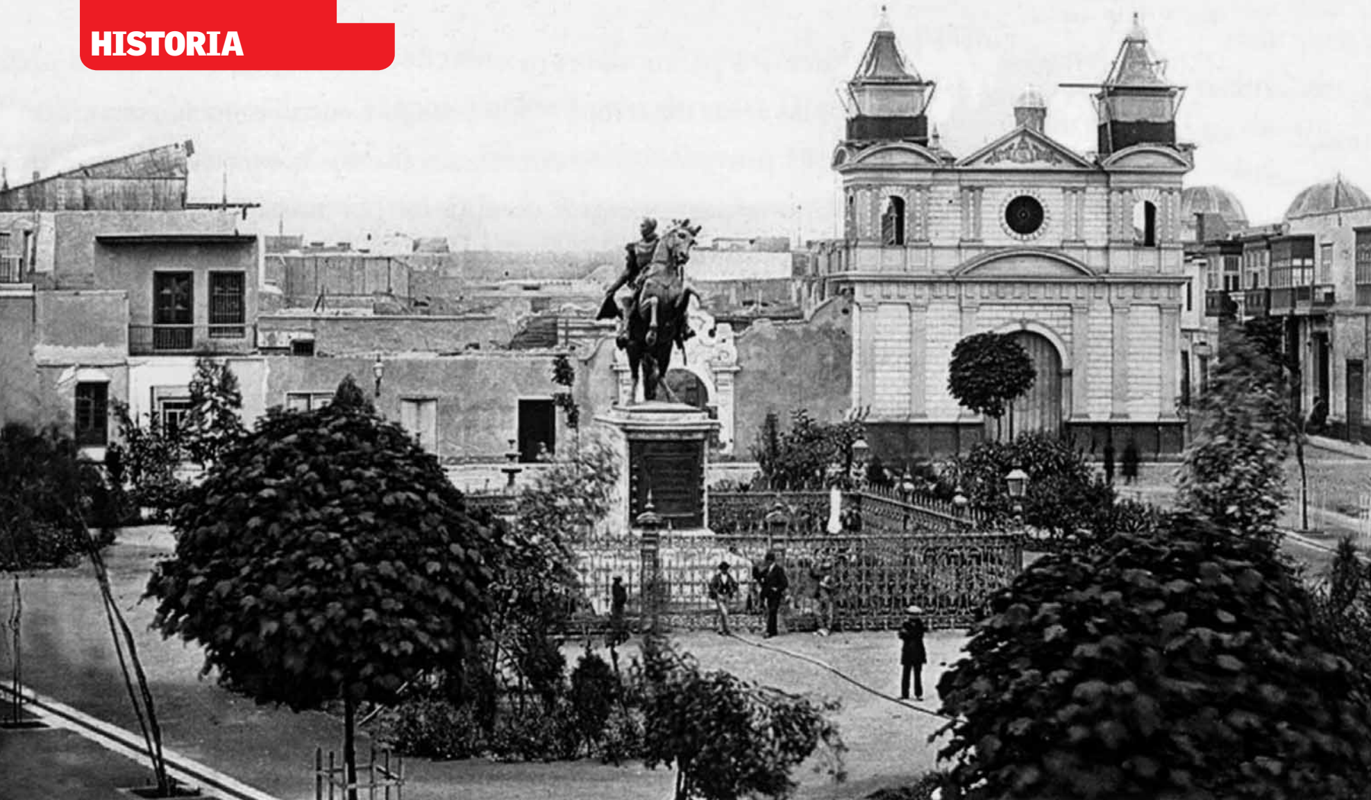
Vista histórica de la Plaza Bolívar, que fuera reconstruida durante el segundo gobierno de Ramón Castilla. Al fondo, el frontis remodelado de la Iglesia de la Caridad.