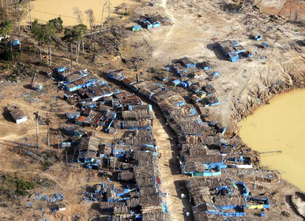
Con la minería ilegal, poblados mineros se han asentado trayendo prostitución y tráfico infantil.