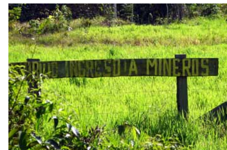
Pese a advertencias, minería ilegal avanza.

Mientras hasta hace dos años el antiguo bosque virgen de Madre de Dios albergaba palpitante vida, hoy muestra la actividad de alrededor de 64,000 mineros informales (gran parte proveniente de Puno) que, con 8,000