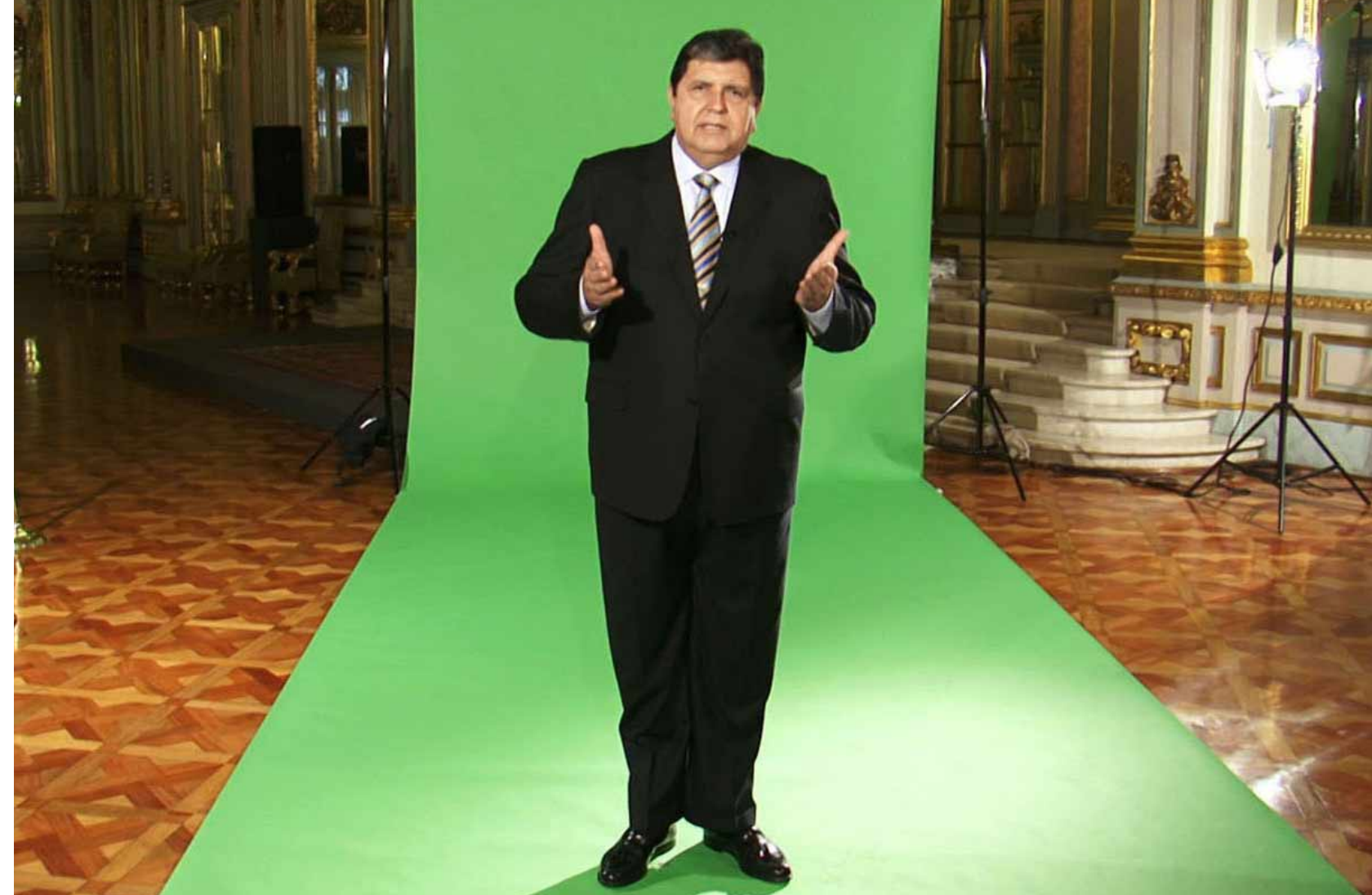
Presidente Alan García en la alfombra verde del chroma, tecnología como la que usó James Cameron en Avatar . Su imagen dará la bienvenida abajo, en el pabellón de Perú Now.