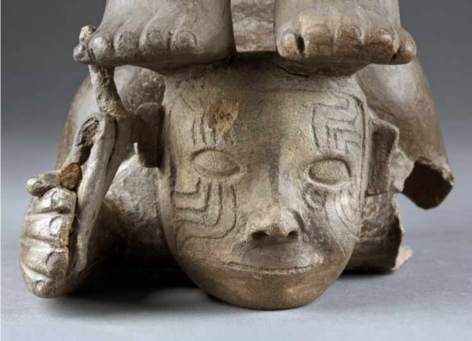
Metáfora del esfuerzo. "El contorsionista", de la muestra De Cupisnique a los Incas .

Se trata de la mayor obra de infraestructura realizada en medio siglo en el Palacio de la Exposición.