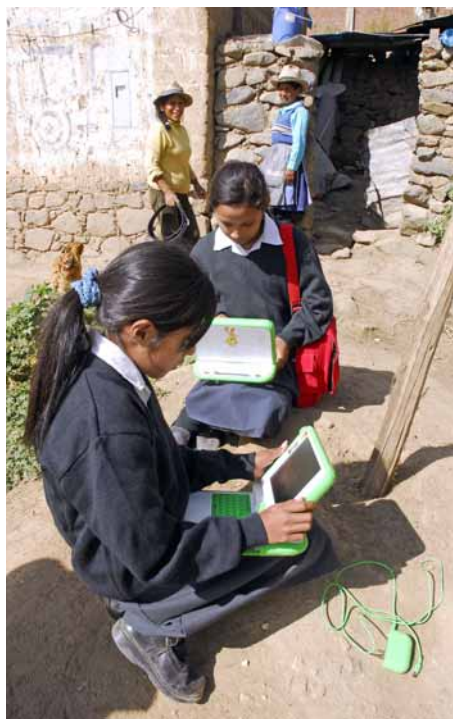
El reparto de laptops debe continuar.

La nueva Ley de Carrera Magisterial condiciona el ascenso y salario de