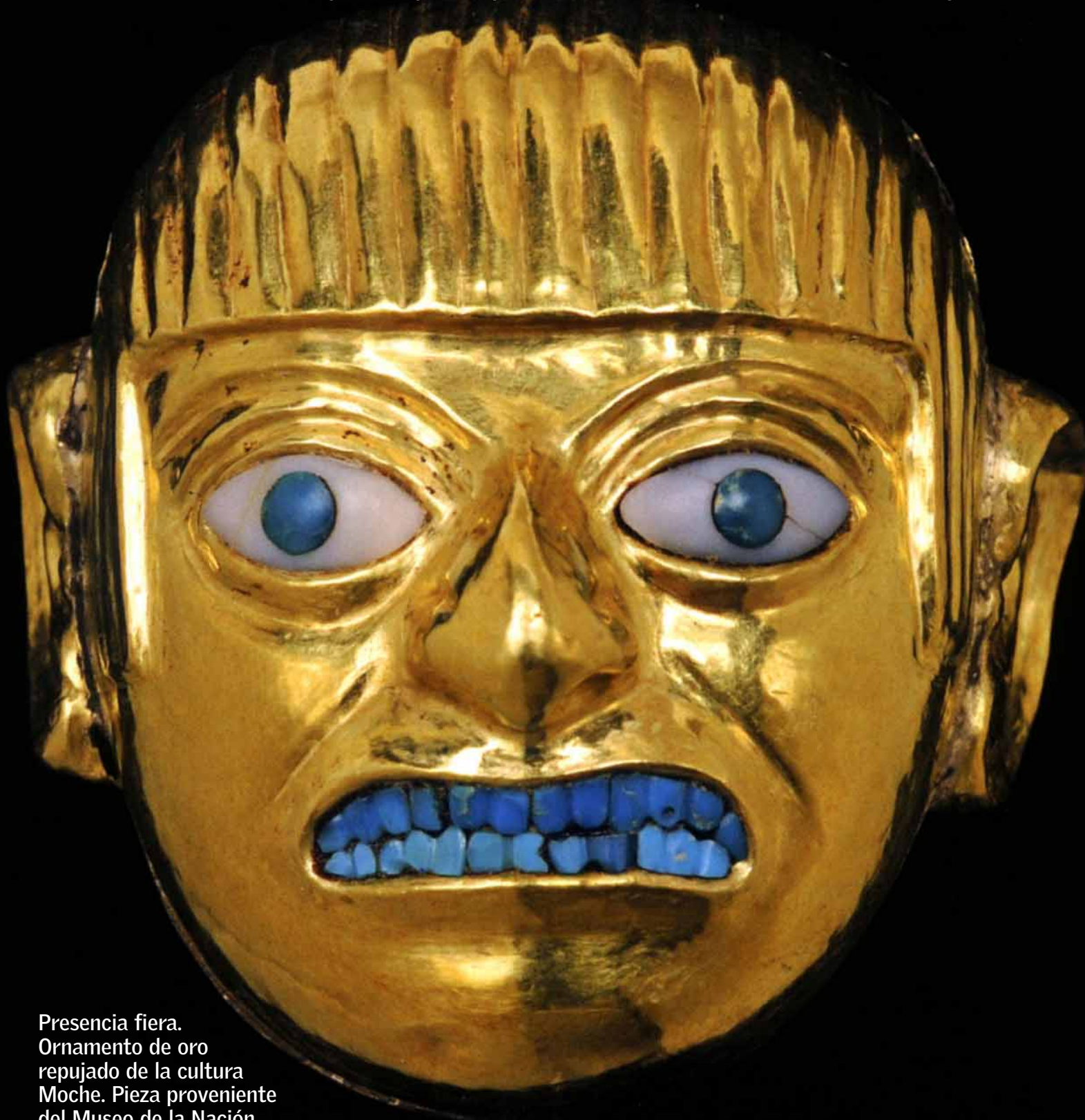
Presencia fiera. Ornamento de oro repujado de la cultura Moche. Pieza proveniente del Museo de la Nación.

Brillante exhibición de piezas prehispánicas del Perú deslumbra en la capital sueca.