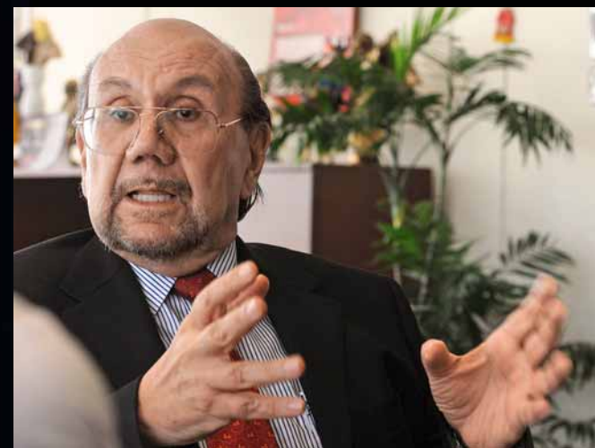
Ex ministro de Cultura Juan Ossio aprobó la exhibición en Suecia.

Guerreros precolombinos y fieros rostros de seres antropomorfos pueblan las cavernas debajo del Museo del Lejano Oriente en la capital de Suecia.