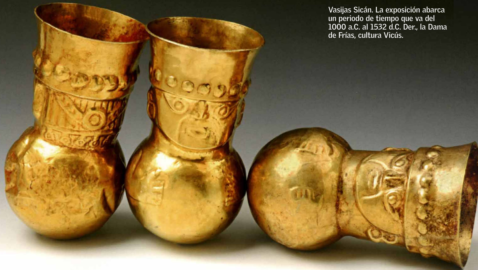
Vasijas Sicán. La exposición abarca un periodo de tiempo que va del 1000 a.C. al 1532 d.C. Der., la Dama de Frías, cultura Vichu.