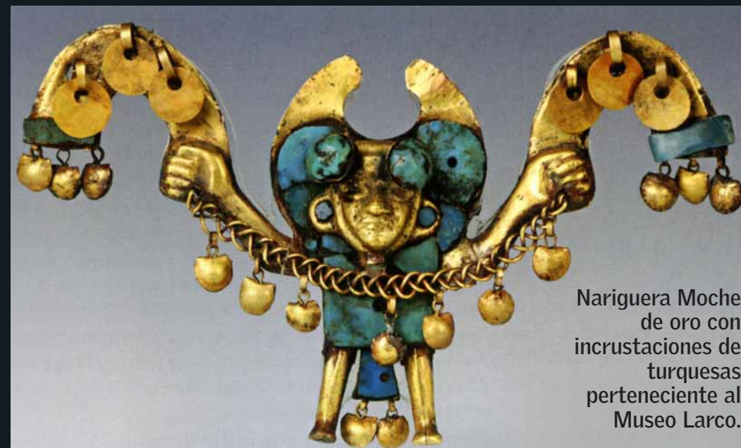
Nariguera Moche de oro con incrustaciones de turquesas perteneciente al Museo Larco.

• pueblan ahora ese espacio con una muestra que antes ya se presentara de manera exitosa en París y en Brescia, Italia, gracias al trabajo de la historiadora Paloma Carcedo, actual directora general de Patrimonio Cultural del Ministerio de Cultura del Perú.