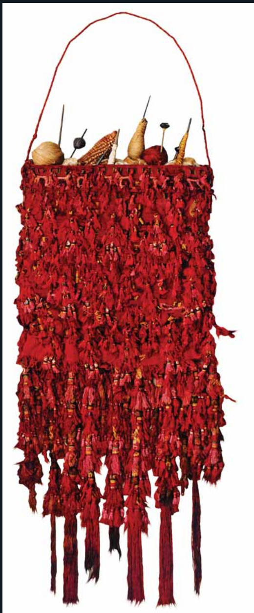
Bolso Chimú del Acervo Leistenschneider.

el trabajo en metal, los textiles, y piezas de madera y piedra, tanto del periodo incaico como de otras culturas como Sicán, Moche, Cupisnique y Chancay.