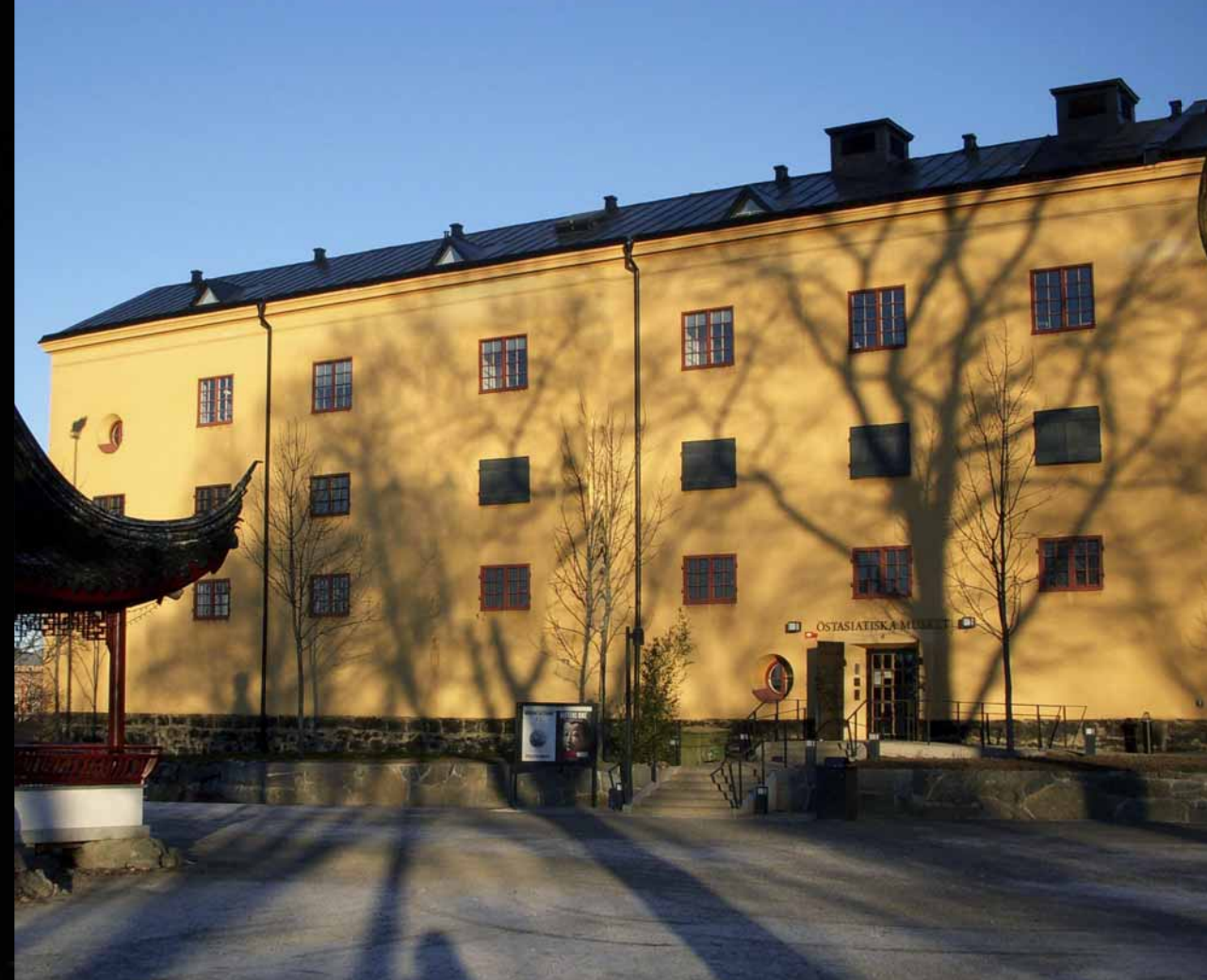
Museo del Lejano Oriente en Estocolmo, debajo del cual se encuentran las cavernas que acogen la exposición sobre el legado precolombino peruano. Der., copa Chimú.

Guerreros precolombinos y fieros rostros de seres antropomorfos pueblan las cavernas debajo del Museo del Lejano Oriente en la capital de Suecia.