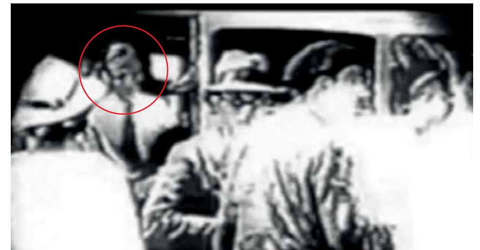
Al fondo hay sitio. Sí, es Vallejo bajando de un autobús. Delante está Pablo Neruda.