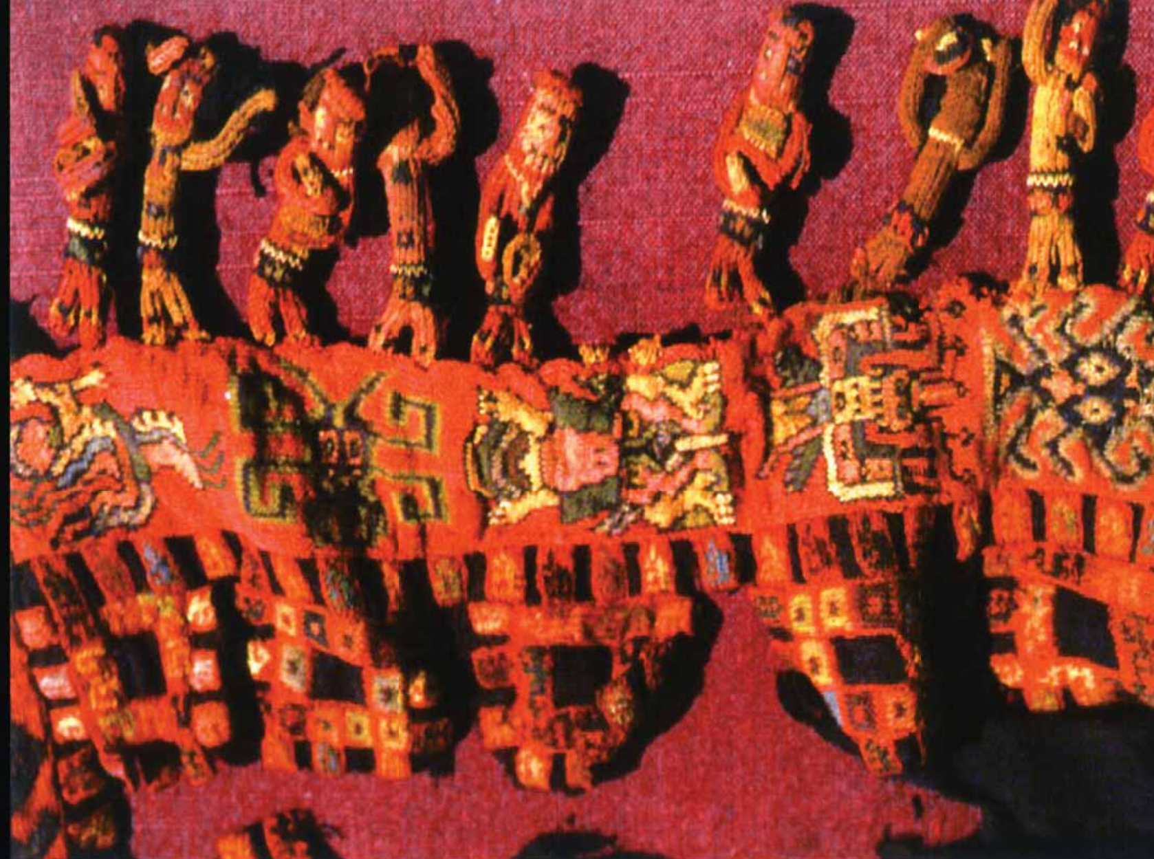
Detalle de un manto ceremonial con franja tridimensional. Abajo, libros del arqueólogo Giuseppe Orefici son editados por USMP.