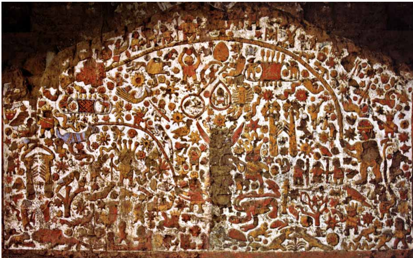
Muro de la Huaca de la Luna. La erosión en la imagen de la Luna (al centro) habría sido causada por la sangre de las ofrendas.

➔ Más allá de presagios apocalípticos, sin embargo, lo cierto es que esta publicación cuenta con dos investigaciones que echan luz sobre esos muros considerados como la “Piedra Rosetta” del mundo Moche, en alusión a aquella que gracias al francés Champollion permitiera descifrar los jeroglíficos egipcios.